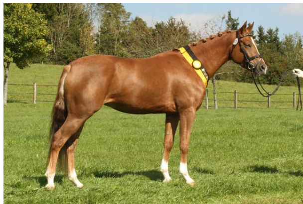
Nubia G - Gesamtsiegerstute

Marbach/L. (PZV BaWü). Bei der diesjährigen Verbandsstutenschau des Pferdezuchtverbandes Baden-Württemberg konkurrierten am Sonntag, dem 19. September 2010 in der großen Reithalle des Haupt- und Landgestüts Marbach 64 Stuten und 5 Stutenfamilien aus 10 verschiedenen Rassen um die Siegerschärpen. Mit 28 vorgestellten Stuten waren die „Kleinsten“ der Rassen Shetland- und Partbred Shetlandponys sowie Classic Pony am stärksten vertreten, gefolgt von 17 Haflinger-/Edelbluthaflingerstuten, 12 Sport-, 7 Welshponys sowie 2 Fjord- und 1 Islandstute. Die Richter vergaben auf 2 Ringen insgesamt 36 erste und 10 zweite Staatspreise sowie 21 erste und 2 zweite Verbandspreise, 11 vergebene Staatsprämien und 4 Staatsprämienanwartschaften rundeten das qualitätsvolle Ausstellungslos ab.