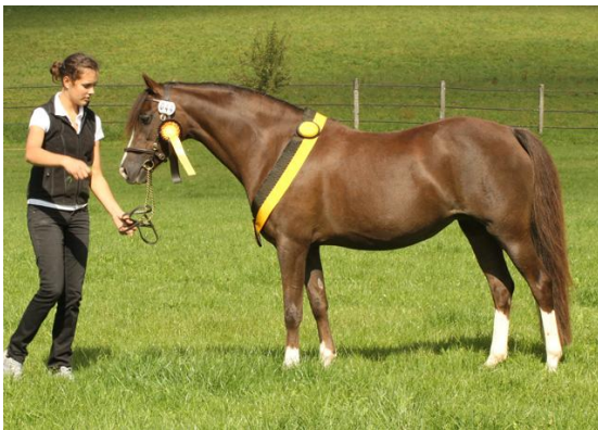
Kaiserbach's -Vanessa beste Welshstute