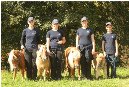
Aktive Jungzüchter stellen Siegerfamilie